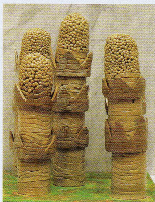
造形「NOBISIRO」 小平市立あおぞら福祉センター友遊グループ