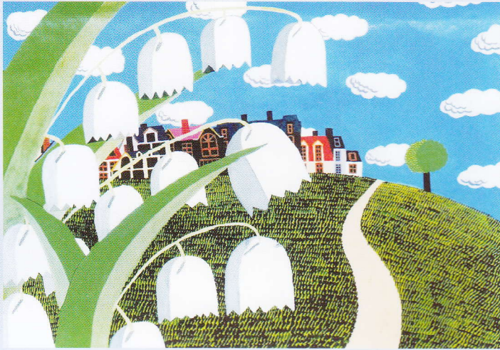
絵画「すずらんの道」久保 真寛

平成27年8月6日(木) ▶ 8月10日(月) 午前10時～午後9時 [最終日は午後4時まで] 西武池袋本店 7階(南) 催事場 特設会場 入場無料