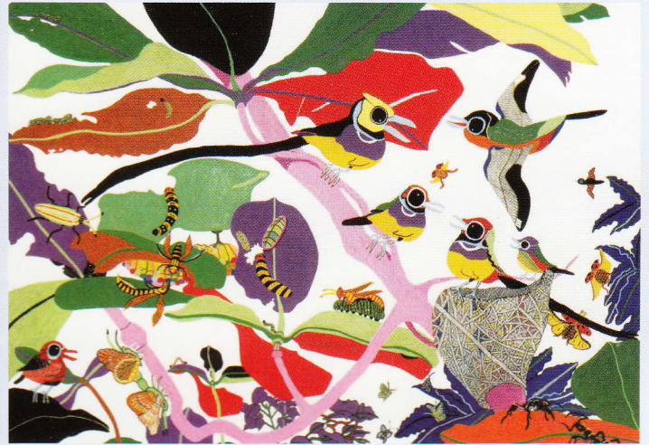
絵画「森の詩」七海 進治